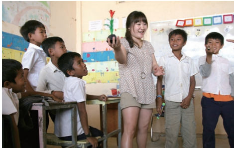
레크리에이션 시간에 선보인 미술쇼.

그렇게 5박 7일의 일정 동안 퓨전 탈춤과 K-POP 댄스를 비롯해 모형 비행기 만들기, 리듬 합주, 레크리에이션, 풍선 아트, 팔찌 공예, 페이스 페인팅, 특식 봉사 등 다양한 활동을 통해 아이들과 소통했습니다. 그러다 보니 어느새 아쉬운 이별의 시간이 다가왔죠. 우리가 할 수 있는 최선을 다해 아이들에게 추억을 선물했고, 아이들은 우리에게 감동이라는 아주 큰 선물을 주었습니다.