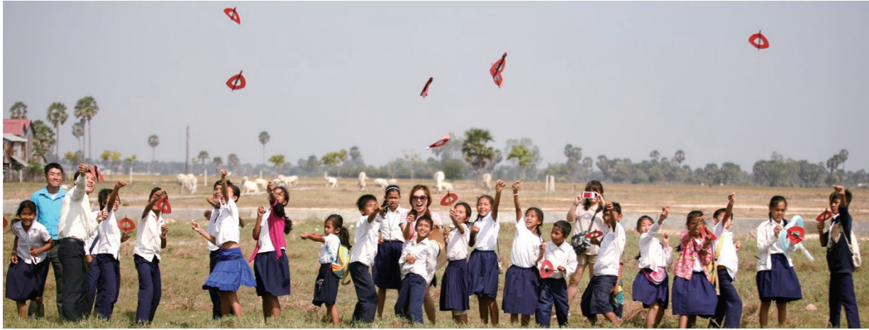
모형 비행기를 만들어 날리는 아이들.