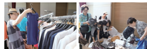
글 _ 서정기(사회복지사) · 후원팀

“ 작은 나눔이 누군가에게 큰 기쁨이 될 수 있다는 것에 감사했습니다. ”