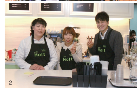
1 장애인 휠체어 농구대회. 2 장애인들이 운영하는 홀트 카페.