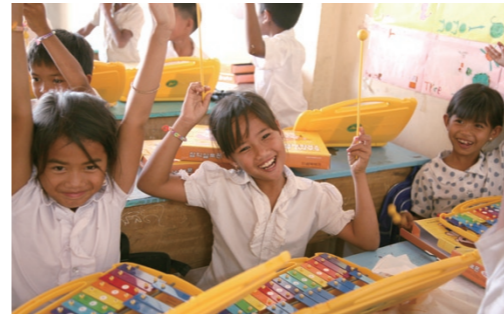
음악시간에 실로폰을 연주하며 즐거워하는 아이들.

홀트학교 선생님들이 올해 1월 캄보디아 드림센터로 봉사활동을 떠났습니다. 아이들에게 부족한 예체능 교육을 하고, 새로운 꿈을 채워주기 위해 떠난 여정에서 홀트학교 선생님들은 아이처럼 행복했습니다. 아이들의 미래에 희망의 디딤돌을 놓아주기 위해 떠난 나눔 교육의 현장, 캄보디아 트라피앙 안찬 마을로 여러분을 초대합니다.