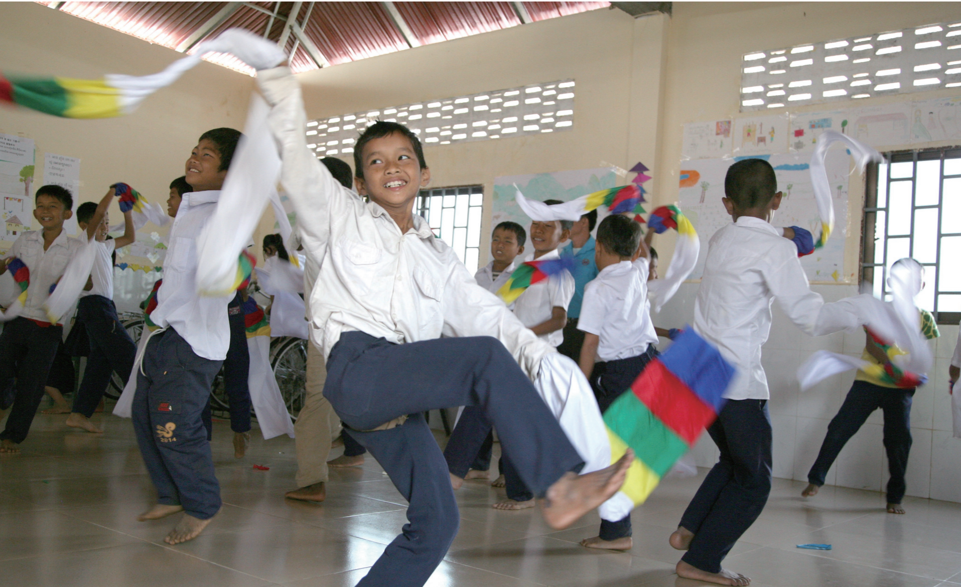
K-POP 음악에 맞춰 한삼을 흔들리며 춤을 추는 아이들.