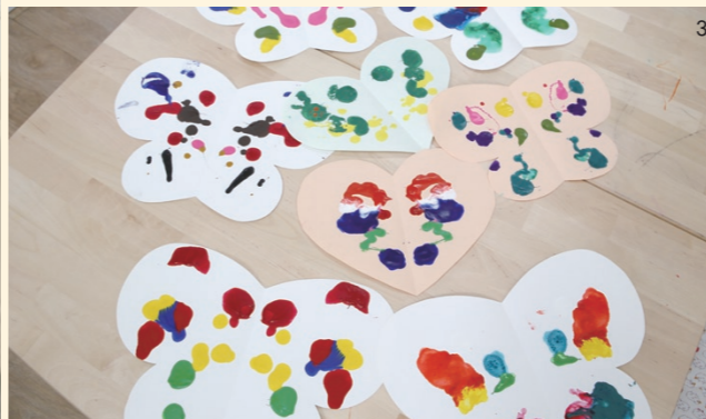
1 새로운 활동 프로그램 공간을 축하하는 김대열 회장, 정혜영, 송재호, 선홍보대사. 2 아이들의 인지발달을 위한 교구와 장난감들. 3 미술 활동 시간에 아이들이 만든 작품.

래됐고, 요즘처럼 입양 대상 아동의 평균 연령이 높을 때까지 양육해본 적도 거의 없기 때문에 연령에 맞는 놀이 방법을 배워, 위탁 아동들의 언어·사회·정서 발달을 도울 필요가 생겼기 때문에 아이들과 위탁모를 위해 이 프로그램은 꼭 필요한 것이었습니다. 아이들은 이제 새로 만들어진 놀이 프로그램 공간에 위탁모의 손을 잡고 두근거리는 마음으로 들어와 장난감을 가지고 놀고, 친구들과 어울립니다.